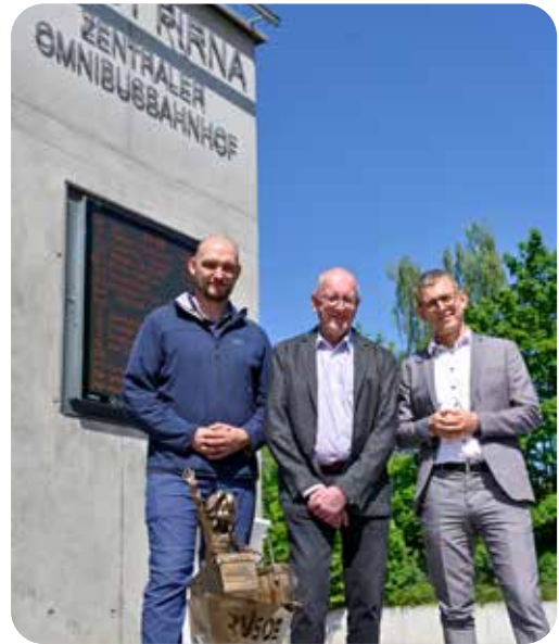
Drei Männer und eine Idee: Stadtmarketing, RVSÖE und Stadtverwaltung Pirna (v.l.n.r.) stehen gemeinsam für den Mobilitätsmix in Pirna.

Die kleine Bronzefigur steht symbolisch für das vielfältige Mobilitätsangebot der Regionalverkehr Sächsische Schweiz-Osterzgebirge GmbH (RVSÖE). Mit zahlreichen Buslinien, Fähren und der Kirnitzschaltbahn sorgt das Unternehmen für nachhaltige Mobilität im gesamten Landkreis und lädt zugleich dazu ein, Pirna und die Region mit öffentlichen Verkehrsmitteln zu entdecken.