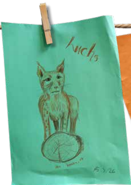
Luchs | von: Hanka