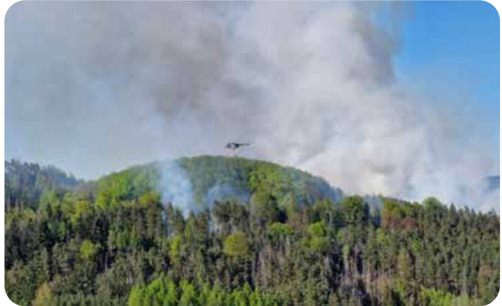
Der Waldbrand in Böhmen wurde Dank Schnelligkeit und perfekter Abläufe sicher unter Kontrolle gebracht.

Im Nationalpark Böhmisches Schweiz war am Samstag, dem 2. Mai 2026, ein Waldbrand ausgebrochen. Es wurde relativ schnell ein sehr ernster Einsatz mit zeitweise 7 Löschhubschraubern und unzähligen Feuerwehren aus ganz Tschechien.