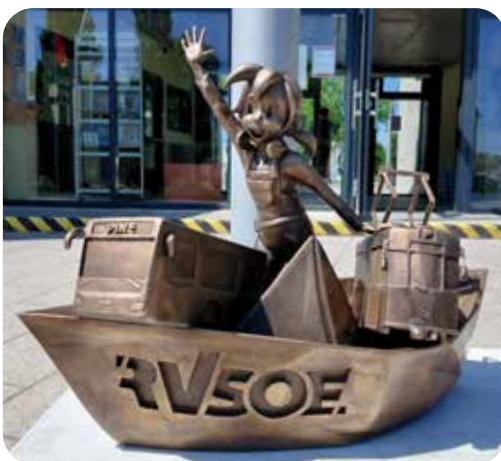
Die „Mobilitätspine“ steht für nachhaltige Mobilität für Pirna und sein Umland.

Die Pine-Figuren wurden Anfang 2024 im Rahmen der Vereinskampagne „Pirna vereint“ ins Leben gerufen, die vom Stadtmarketing Pirna initiiert wurde. Die RVSÖE-Pine ist die 16. Bronzefigur dieser Reihe, die die Kinderbloggerin „Pine“ jeweils in Verbindung mit thematisch passenden Symbolen im Innenstadtgebiet von Pirna zeigt.