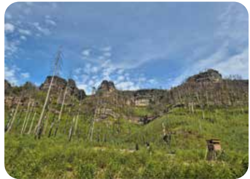
Die Natur erholt sich langsam. Das frische Grün setzt sich durch, wie hier unterhalb des Prebischtores.

Erreicht wurden bereits die Archivierung historischer Luftbilder, erste Analysen zu Waldveränderungen sowie der Aufbau der Website. Auch ein Buch über die Waldentwicklung und die Erfassung dieser mittels Fernerkundung ist in Arbeit.