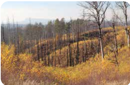
Blick in die Waldbrandflächen (2022) auf böhmischer Seite. Im Hintergrund der große Zschirnstein.

Seit 2025 arbeiten die beiden Nationalparkverwaltungen, Universitäten und Experten an einem Waldinformationssystem. Dieses umfasst ein Portal für den Datenaustausch zwischen den Parks sowie eine Website für die Öffentlichkeit ( https://saxon-bohemian-forests.eu ), die Einblicke in die Waldveränderungen bietet. So können Besucher, Schüler und Wissenschaftler gleichermaßen von den Erkenntnissen des Projektes profitieren.