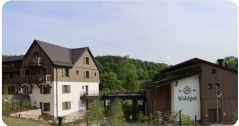
Das neu eröffnete Waldgut liegt etwas versteckt in einer Waldlichtung in absoluter Alleinlage.

Wer sich zum ersten Mal zum Waldgut begibt, ahnt oft nicht, was sich zwischen den Wäldern und Wiesen von Langenhennersdorf verbirgt. Von der Straße aus führt der Weg zunächst vorbei an kleinen Sandsteinfelsen mitten im dichten Wald.