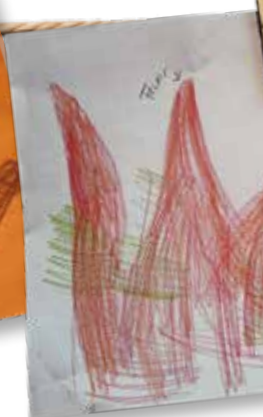
Feuer