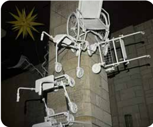
Kunstaktion von Reinhardt Wehle, die auf eine barrierefreie Zugänglichkeit aufmerksam machen soll.

tung instandgesetzt. Damit die stets offene Kirche künftig auch barrierefrei zugänglich wird, machte Reinhard Wehle im Mai 2025 mit einer Kunstaktion auf dieses Anliegen