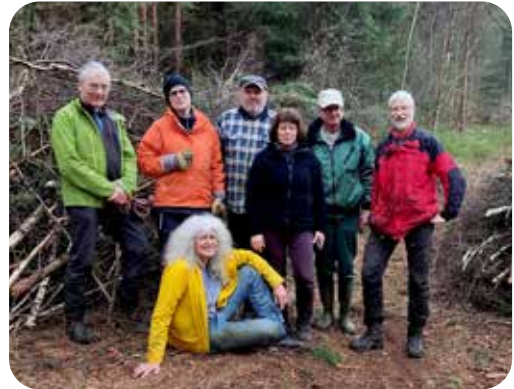
Ein Tag für die Natur hilft und trägt zur Gemeinschaft bei.