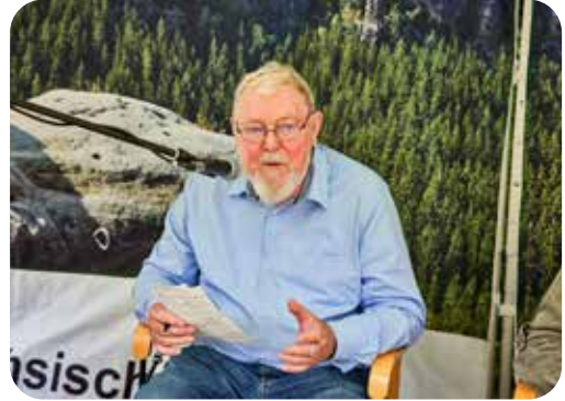
Michael Succow 2020 beim Aktionstag zum 30-jährigen Bestehen des Nationalparks Sächsische Schweiz.

Eine historische Leistung gelang ihm 1990 als stellvertretender Umweltminister der DDR: Mit dem sogenannten Nationalparkprogramm stellte er gemeinsam mit Weggefährtinnen und Weggefährten