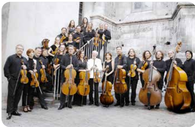
Kremerata Baltica ist ein baltisches Kammerorchester, das 1997 von dem lettischen Geiger Gidon Kremer gegründet wurde.