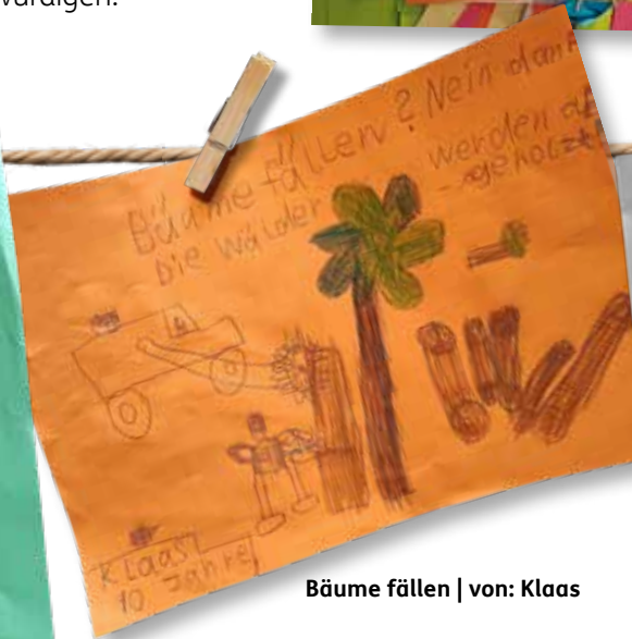
Bäume fällen | von: Klaas