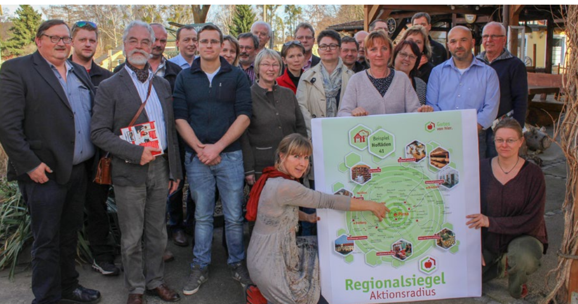
Die „Mitmacher“ am Fachworkshop in Cotta.