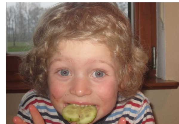
Nur der Überzeugte überzeugt. (Joseph Joubert)