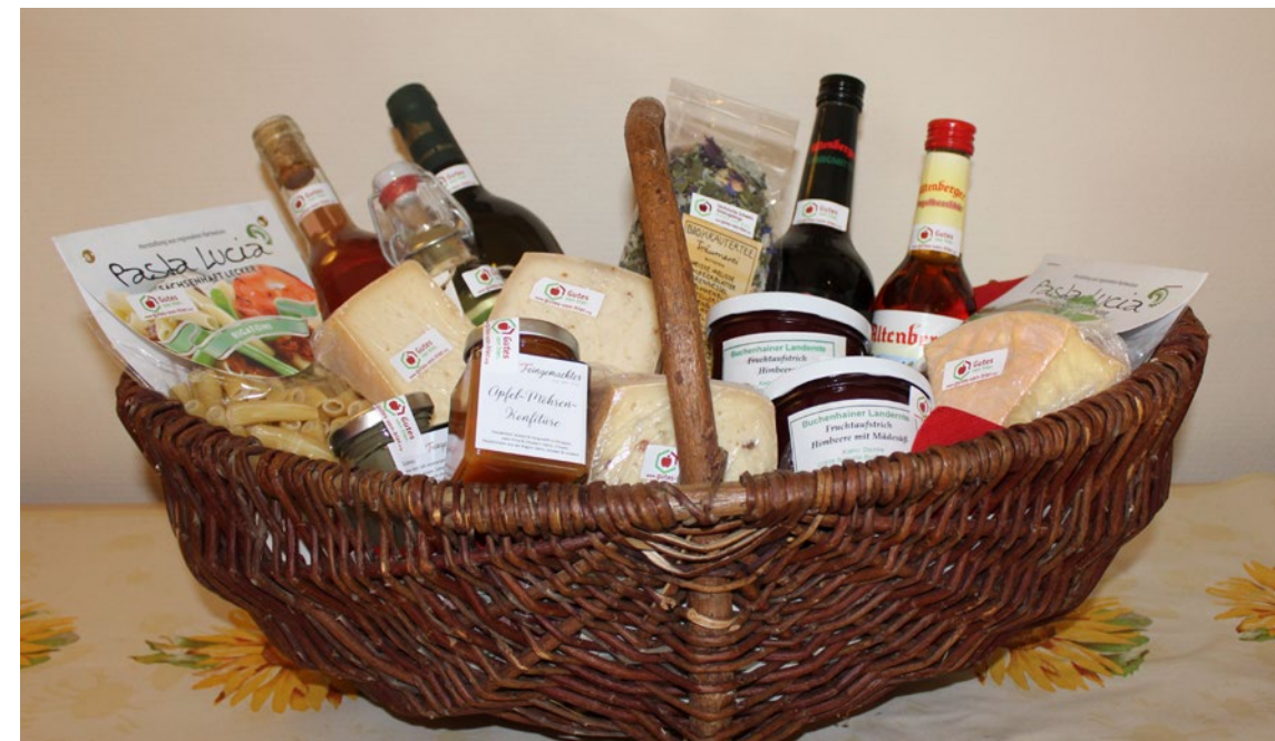
Präsentkorb gefüllt mit „Gutem von hier.“

Facebook – auch wir nutzen diese Möglichkeit zeitgemäßer Kommunikation, um den Inhalten und Ideen Raum zu geben, die in den limitierten Druckmedien keinen Platz finden und um den Austausch mit Interessenten zu fördern.