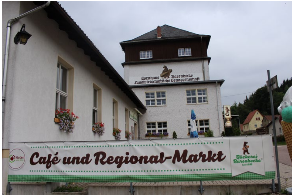
Werbepläne am Parkplatz der Bäckerei Bärenhecke