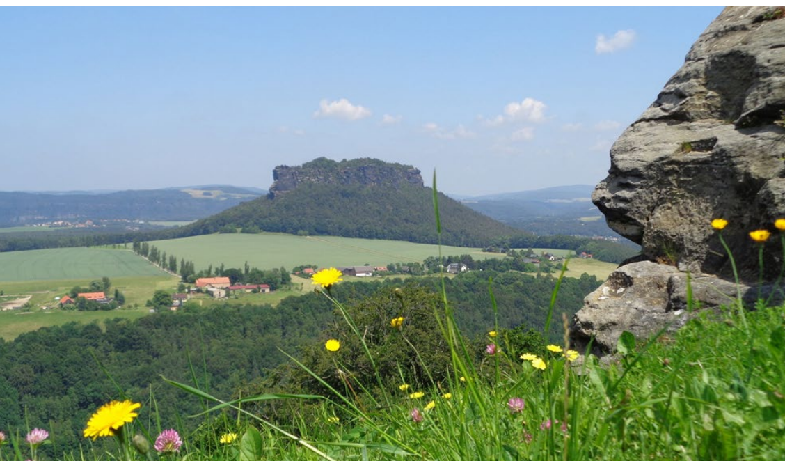
Blick von der Festung Königstein über die Elbe zum Lilienstein

Es war einmal. So fangen alle guten Geschichten an. Und dies ist eine gute, noch dazu eine „Gute von hier“.