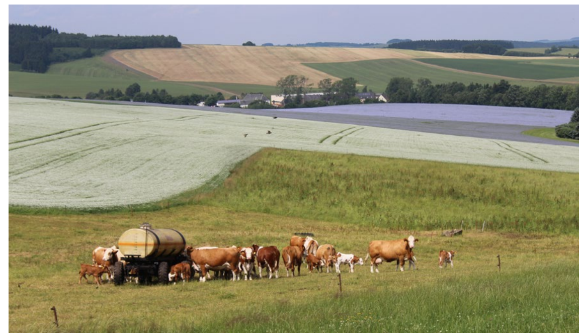
Clausnitz bei Rechenberg-Bienenmühle im Leinblüten-Rausch

Auf der gemeinsamen Suche nach Erzeugern, die diese Lebensmittel herstellen, anbieten bzw. verwenden, wurden viele leckere Produkte und Angebote gefunden. Bald schon merkten die Menschen auch, dass die meisten ihrer Nachbarn „Gleichgesinnte“ waren. Schnell verbündete man sich miteinander und beschloss,