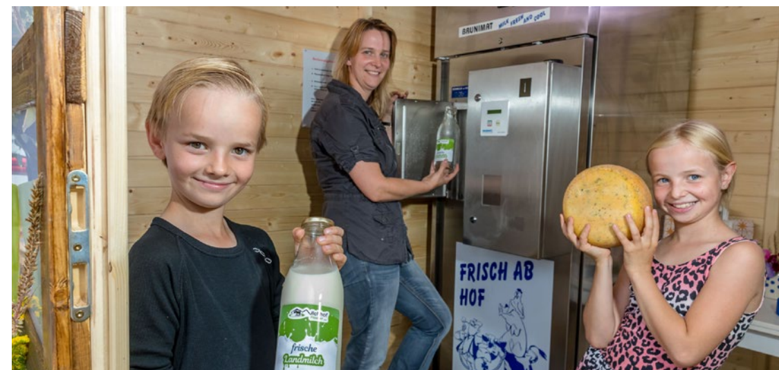
Jüngstes Mitglied der Datenbank, seit April 2017 dabei: der Milchhof Fiedler

Lag noch vor 2 Jahren der Hauptschwerpunkt bei der Akquise geeigneter Unternehmen zum „Befüllen“ der Datenbank, dominieren heute Anfragen