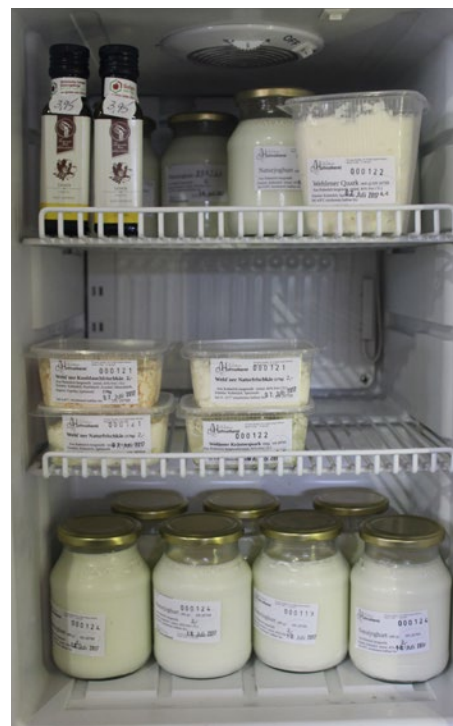
Gefüllter Kühlschrank in der Gärtnerei Zschieschang in Jessen.