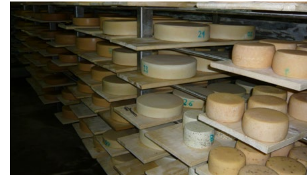
Hier reift guter Käse im Keller

Zum Hof gehören eine historische Käserei sowie das mit der „Anerkennung für barrierefreies Bauen des Preises Ländliches Bauen 2013“ ausgezeichnete Haupthaus, welches eine behindertengerechte **** - Pension beherbergt. An die Bebauung erstrecken sich ausgedehnte Streuobstwiesen. Momentan finden 10 Mitarbeiter auf dem Hof ihr Auskommen, unterstützt durch eine FÖJlerin, die sich in allen Bereichen des Biohofes ausprobieren kann.