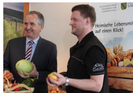
Auch Sachsens Umweltminister Schmidt (li.) wurde am Stand begrüßt.

Auf dieser Plattform können sich Hersteller, Direktvermarkter und Regionalinitiativen präsentieren. Interessenten können sich nach Anmeldung kostenlos selbst in die Datenbank eintragen. Verbraucher haben die Möglichkeit, nach verschiedenen Kriterien die Angebote zu durchforsten. Betreiber des Portals ist der Freistaat - das Landesamt für Umwelt, Landwirtschaft und Geologie (LfULG). Bis zum Start haben sich bereits 71 Firmen eingeloggt, so auch der Landschaft(f)t Zukunft e. V. mit