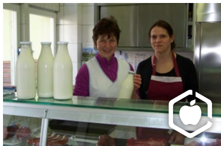
Milchverkauf im Hofladen in Niederseidewitz

Agrargenossenschaft Niederseidewitz e.G.