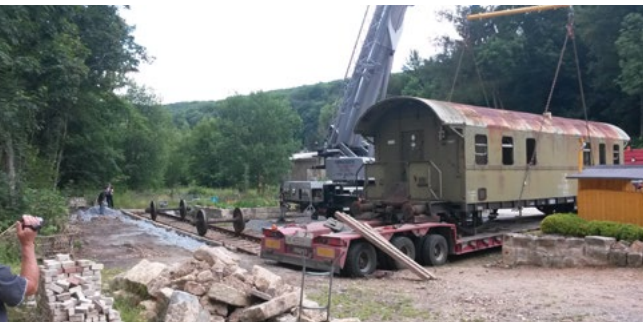
Bald kann auch in der „Donnerbüchse“ genächtigt werden.

Vor 5 Jahren suchten wir ein Grundstück im Gottleubatal, um ein Café mit Kleinkunstabtue zu errichten. Wir fanden schließlich ein altes Wohngebäude mit Nebengelass am verkehrsberruhigten Goethepark in Bad Gottleuba. Die Lage am Park mit Teich und Spielplatz überzeugte uns.