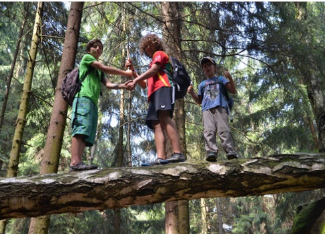
In Balance mit der Natur. Wir brauchen auch "kleine" Botschafter.