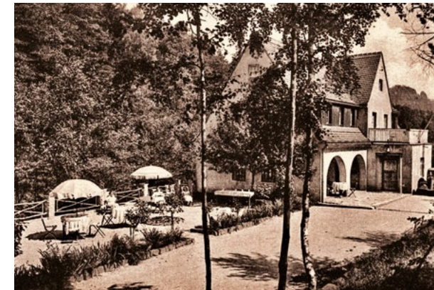
Bald ist wieder neues Leben im "Kuckuckswinkel"

Das Blockhaus wird zu einer rustikalen Ferienwohnung, die Winnetou und Old Shatterhand bestimmt geliebt hätten. Auch kleine Indianer werden es hier so richtig cool finden.