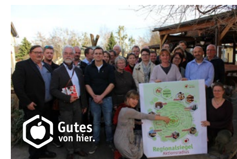
Leider nicht vollständig – die Teilnehmer am Fachworkshop am 16.03.2017

Der Fachworkshop zur Vermarktung regionaler Produkte hat stattgefunden, ist aber noch lange nicht "Geschichte". Nachdem sich jeder Teilnehmer vorstellte, gaben die geladenen Referenten Impulse, wie auf das bisher Erreichte aufgebaut und das Netzwerk ausgebaut werden kann. Die anschließende Diskussion zeigte, dass es wichtig ist, auch in Zukunft einen gemeinsamen Wege zu gehen. Dieser wird nicht immer einfach sein. Vor uns liegt viel, aber auch sehr schöne Arbeit. In diesem Sinne – packen wir es an!!!