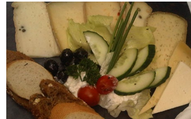
Regional und Bio serviert – was wollen wir mehr. Wohl bekomms!

Hier kann man nicht nur Käse kaufen, sondern auch selbst zum Käser werden. Mit Unterstützung der erfahrenen Käsereimitarbeiter wird eigener Käse hergestellt. Wer dann immer noch nicht genug von all dem Käse hat, kann im Käseseminar sein Wissen ausbauen. Hierfür gibt es freie Termine, die der Internetseite des Hofes zu entnehmen sind.