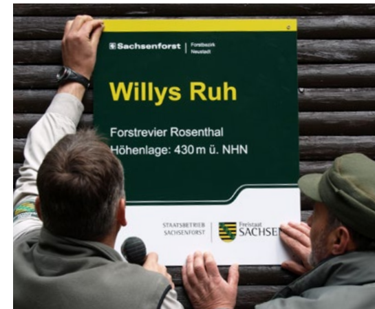
Die Stille genießen im Cunnersdorfer Wald kann man ab sofort in 2 Trekkinghütten.

SACHSENFORST stellt im Elbsandsteingebirge als Pilotprojekt bis Ende September 2015 zwei Waldhütten als Trekkinghütten allen Wanderern zur Verfügung. Diese Hütten sind unverschlossen und per Hüttentickets nutzbar. Erreichbar sind sie nur zu Fuß oder mit dem Fahrrad. Mit diesem Projekt möchte Sachsenforst der allgemein zunehmenden Naturentfremdung entgegenwirken und insbesondere für Familien mit Kindern eine Möglichkeit schaffen, den Wald selbständig fernab einer Siedlung zu erleben. Es ist zu beachten, dass die Hütten keinen elektrischen Strom, keine Matratzen und kein Trinkwasser haben.