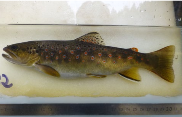
Das Original einer Kirnitzsch-Bachforelle

Die Bachforelle bewohnt sauerstoffreiche und sommerkalte Bäche. Dabei ernährt sie sich hauptsächlich von Kleinkrebsen, Insektenlarven und Anflugnahrung. Die Bachforelle ist ein typischer Bewohner von Fließgewässern. Als Charakterart für einen bestimmten Abschnitt eines Fließgewässers ist nach ihr die Bachforellenregion bezeichnet.