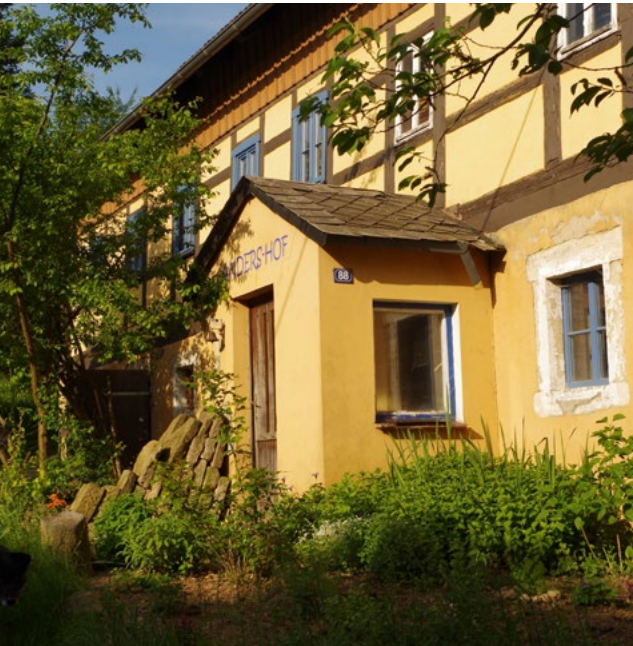
Der Anders-Hof ist biologisch zertifiziert und seit 2009 Nationalparkpartner.

Am 20. Juni 2015 ab 14.00 Uhr feiern wir 20 Jahre Anders-Hof.