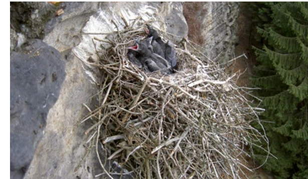
Junge Kolkraben im Reisignest am Sandsteinfels.

Bachstelze und der Zaunkönig bauen ihre Nester fast ausschließlich in Löcher und Risse von Felsen, fast immer direkt über dem Wasser. Vereinzelt brüten auch Ringeltaube, Amsel, Singdrossel, Rotkehlchen, Grauschnäpper, Waldbaumläufer und Aaskrähe an den Felsen. Als Ausnahmen wurde dies wenige Mal bei Stockente, Mäusebussard, Schleiereule und Star beobachtet. Auch die Neusiedler in unserer Heimat, Schwarzstorch und Kolkrabe, errichten ihre großen Horste hier überwiegend auf Felsen.