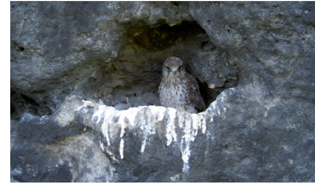
Junge Turmfalken im Sandsteinhorst.

Heute sind von 35 Vogelarten sichere Brutnachweise an oder auf den Sandsteinfelsen erbracht. Ausschließlich als Felsbrüter treten im Elbsandsteingebirge, mit Ausnahme der Städte und Dörfer, Wander- und Turmfalke, der Uhu, die Dohle und der Hausrotschwanz, ein Hochgebirgsvogel, auf. Viele andernorts in Baumhöhlen brütenden Vögel, wie Waldkauz, Hohltaube, Mauersegler, fast alle heimischen Meisenarten, der Kleiber und die beiden Rotschwänze nutzen den Reichtum der durchlöchernten Sandsteinfelsen zur Anlage ihrer Nester. Auch beim in Buntspechthöhlen brütenden Sperlingskauz wurde schon das Verstecken von Beute in kleinen Felslöchern festgestellt. Die an den Bergbächen beheimatete Wasseramsel und die Gebirgsstelze, aber auch die