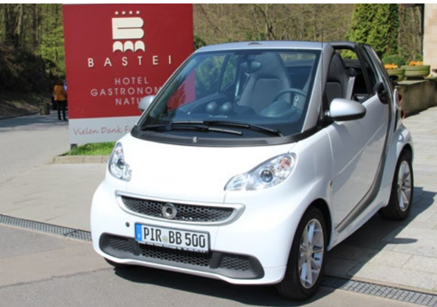
Smart unterwegs mit dem Smart