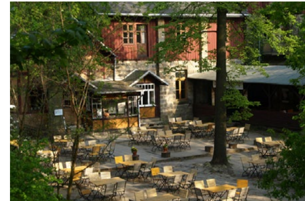
Der Nationalpark-Partnerbetrieb Berggaststätte Pfaffenstein hat keine direkte Busanbindung. Der Aufstieg dauert ca. 45 Minuten.

Gaststätte und Pension Schrammsteinbaude Zahngrund 5 · 01814 Bad Schandau Telefon 035022/50200 www.schrammsteinbaude.de