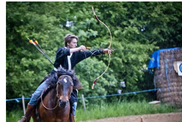
Therapeutisches Reiten sowie Bogenschießen mit und ohne Pferd bietet der Anders-Hof.