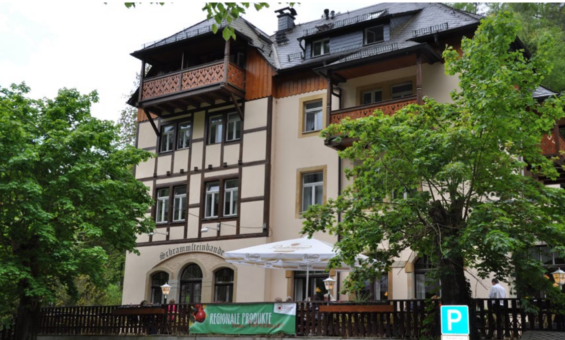
Die Schrammsteinbaude ist auch gut mit der Buslinie 252 erreichbar.

Die Berggaststätte Pfaffenstein und die Gaststätte/Pension Schrammsteinbaude gehören zu den ersten Gastronomiebetrieben, die in die Datenbank Regionale Produkte des Landschaft(f)t Zukunft e. V. aufgenommen wurden.