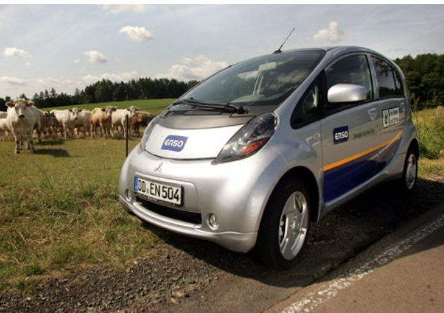
2 Stück des Mitsubishi i-MiEV stehen bald für Jedermann im Kurort Rathen und Bad Schandau für Fahrten bereit.