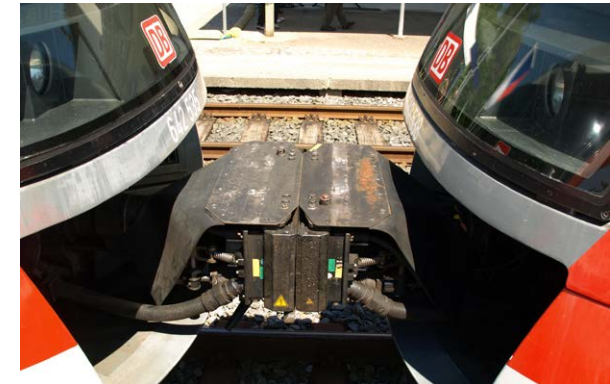
Hier wird nicht mehr abgekoppelt! Bahn frei zwischen Böhmen und Sachsen.

Doch auch andere Projekte haben kurz vor den Sommerferien noch einmal einen kräftigen Schub erfahren. Nehmen wir das aufgefrischte Vermarkterportal „Gutes von Hier“: Ende Juni konnte die neue Internetseite ( www.gutes-von-hier.org ) offiziell eingeweiht werden. Das Interesse steigt täglich auf beiden Seiten – das der Erzeuger und das der Kunden. Bei den Nationalparkpartnern mit Verköstigung ist es Teil der Zertifizierung, nachweislich regionale Produkte zu verwenden. Wichtig dabei ist uns auch, das gegenseitige Verständnis von Landwirt und Küchenchef zu unterstützen. Seit Jahren unterstützt der DEHOGA in der Sächsischen Schweiz das Thema und richtet nun schon traditionell den Pokal der Gastlichkeit aus.