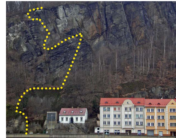
Nur für Geübte – der neue Klettersteig in Děčín.

Das Projekt des Klettersteiges auf die Schäferwand liegt schon lange zurück. Am längsten dauerten die verschiedensten behördlichen Bewilligungen, darunter auch von der Bahnverwaltung, denn durch die Schäferwand führt der Eisenbahntunnel der Strecke Bo-