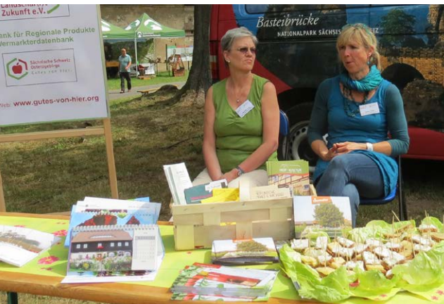
Auch Käseverkostung war am Stand des Vereins Landschaf(f)t Zukunft e. V. möglich.