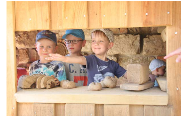
Kommt mit in das „SteinReich“ und erlebt mit uns die Welt der Sagen.

Die Erlebnisswelt „SteinReich“ hat von April bis Oktober täglich ab 10 Uhr geöffnet. Der Eintritt kostet 6 Euro für Erwachsene, 4 Euro für Kinder. Der Besuch des Restaurants SteinBeisser ist ohne Eintrittskarte möglich. Anfahrt mit dem Auto bis zum P+R-Platz Bastei zwischen Lohmen und Rathewalde.