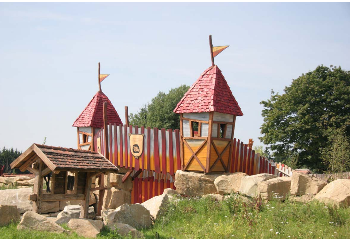
SteinReich ist nicht nur ein Spielplatz – hier steht das Lernen hoch im Kurs

20 % Rabatt auf eine Familienkarte (für 2 Erwachsene und 1 bis 4 Kinder von 4 - 14 Jahren) für die Erlebnisswelt SteinReich