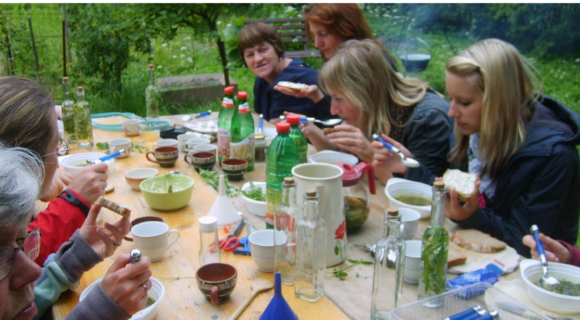
Sehr beliebt bei Kindern der Region ist der Kräuterschmaus. Hier benötigt man Zeit und Muße, um die Geheimnisse der Kräuterwelt zu erfahren.

Dazu nahm sie eine einjährige intensive Ausbildung bei München auf. Nun ist es ihr Ziel, das erworbene Wissen über die Heilkraft bzw. die Wirkung von Pflanzen weiter zu vermitteln und den Menschen den Umgang mit Kräutern, Pflanzen und vermeintlichen Unkräutern wieder nahe zu bringen. Darum bietet sie Kräuterwanderungen an, bei denen man die vielen (Un)Kräuter am Wegesrand kennenlernt und erfährt, wie diese angewendet werden können. Im Anschluss an die Wanderung werden die gesammelten Kräuter gemeinsam verarbeitet und verkostet.