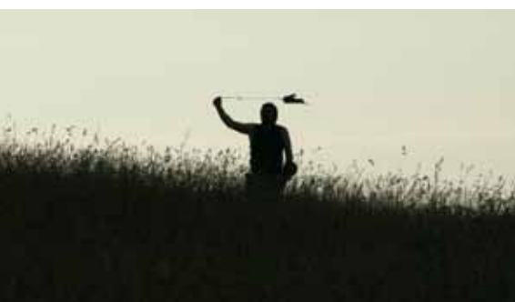
Suche Wanderfalken ...