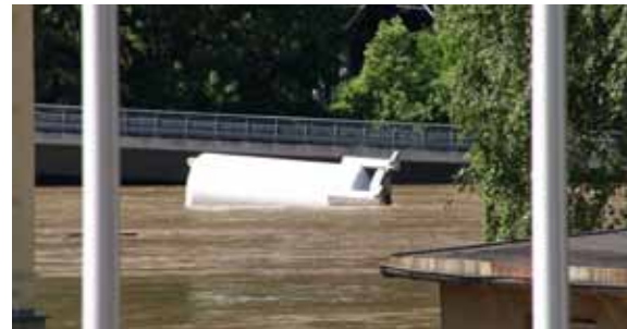
„Gefährliche“ Flaschenpost: Die Meldung hatte sich schnell verbreitet. Gastanks und Container hatten sich im Hafen von Decin losgerissen. Lange war nicht klar, welche gefährliche Fracht da unterwegs war. Mit Hubschraubern wurden einige an die Ufer gedrückt und an die Leine gelegt. Nun liegen sie da noch sehr verlassen auf dem Trockenen. Sie waren zum Großteil leer.