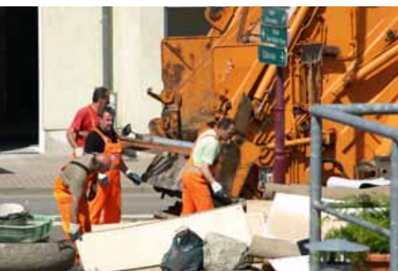
Hochwasser bedeutet leider auch immer sehr viel Müll.