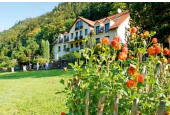
Die Helvetia, wie wir sie wieder sehen wollen (Frühjahr 2013)