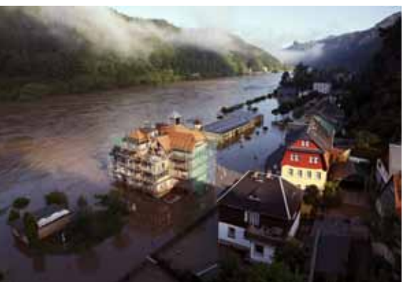
Fast romantisch, wenn es nicht so traurig wäre. Schmilka von der Elbe eingenommen.