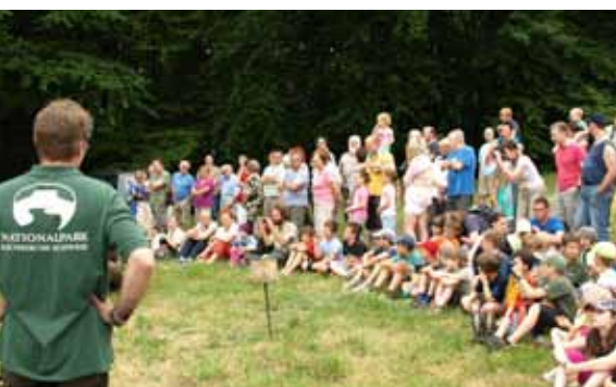
Gespannte Besucherrunde erwartet den Falkner