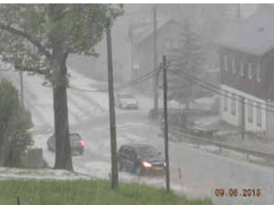
Winterimpressionen im Sommer