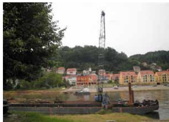
Schwemmgutbeseitigung mit schwerer Technik vom Wasser aus