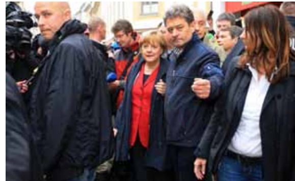
Die Bundeskanzlerin, Angela Merkel, besucht Pirna, bevor der Flutscheitel die Stadt erreicht.

Allgemeine Hinweise finden Sie unter www.smul.sachsen.de/foerderung/3023.htm . ■