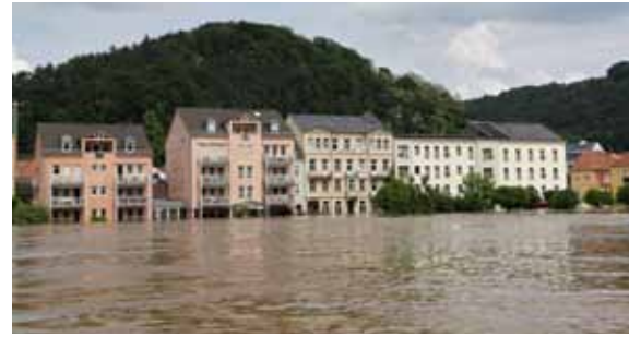
Auch der Sitz der Nationalparkverwaltung in der Elbfront von Bad Schandau war bis Mitte Erdgeschoss umspült.