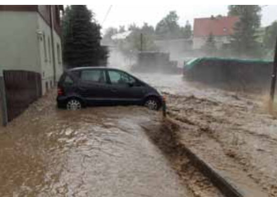
Das Wasser bahnt sich seinen Weg