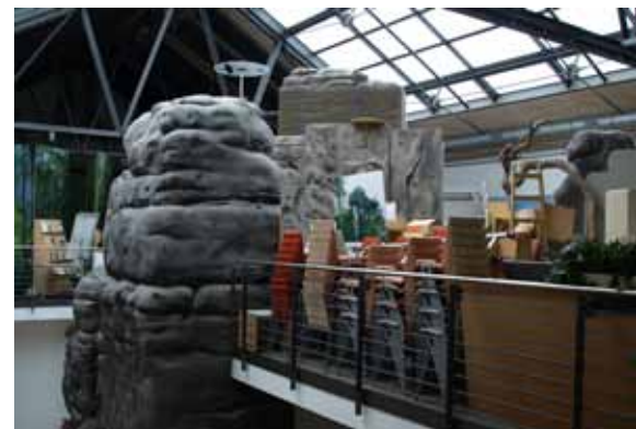
Hochgestapelt - das Nationalparkzentrum auf engstem Raum.