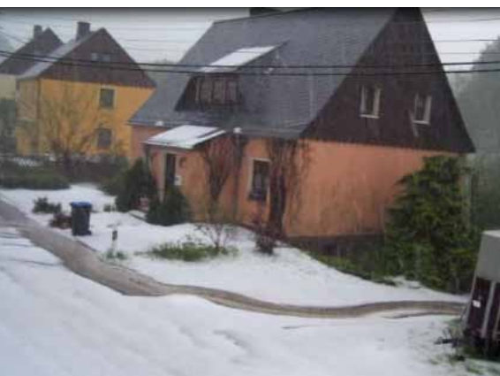
9. Juni 2013 - ohne Worte.