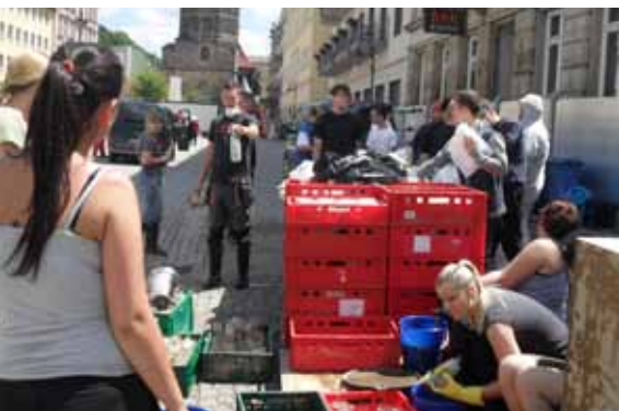
Viele Hände - schnelles Ende. Die zahlreiche Unterstützung und gelebte Solidarität sind beeindruckend.