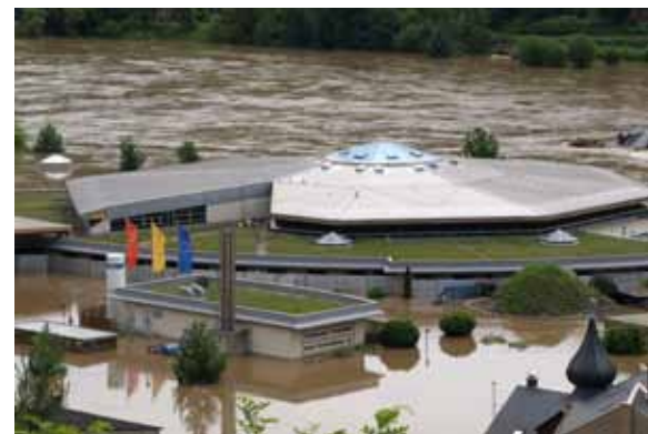
Einer Hallig gleich, die Toscana Therme umzingelt von braunem Elbewasser am 05.06.2013.

Ostsächsische Sparkasse Dresden Kontonummer: 3100061100 BLZ: 85050300 Verwendungszweck: Flutpartnerhilfe 13