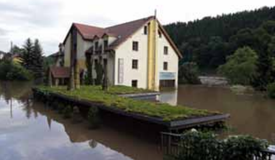
Am 06. Juni 2013, das Hotel im Flutscheitel der Elbe