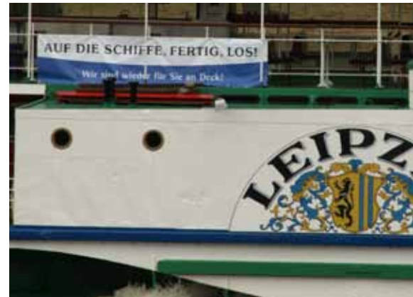
Die Flotte fährt wieder. Noch sind nicht alle Schiffsanleger nutzbar. Bald aber werden wieder die weißen Elbedampfer in Bad Schandau anlegen.

Wir sind wieder unter 035022 / 502-40 und per e-Mail erreichbar. ■