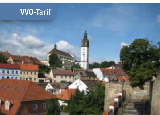
Mit dem Elbe-Labe-Ticket in das böhmische Litoměřice