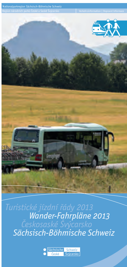
Grenzüberschreitendes Gemeinschaftsprojekt – die Wanderfahrpläne 2013 in neuem Gewand - als Broschüre.