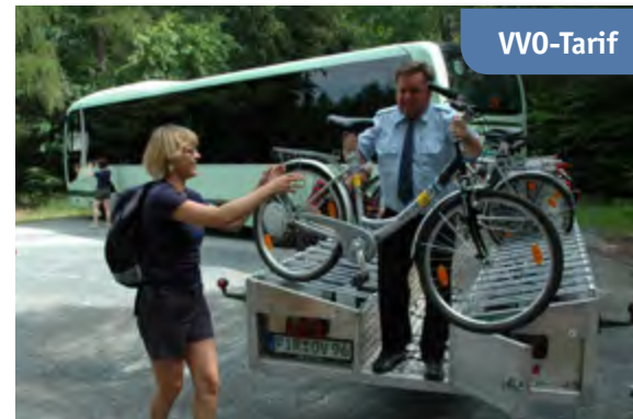
Bis zu 20 Fahrräder kann ein Bus mit Radanhänger transportieren

Unser Tipp für die Woche: Die Fahrradbuslinie 219/217 von Pirna über Bahratal, Grenze bringt Sie auch in der Woche 2-mal täglich 08:10 Uhr und 10:10 Uhr hinauf nach Tisá. Hier locken die Tyssaer Wände zur Besichtigung, bevor die Tour ins Elbtal z.B. nach Děčín beginnt. Auf dem Elberadweg geht es dann von Děčín zurück. Wer möchte kann ab Schöna die S-Bahn für die Heimfahrt nutzen.