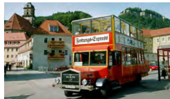
Der Festungsexpress bringt Sie bis zum Parkhaus an der Festung Königstein.

Frank Nuhn - Freizeit und Tourismus, Oldtimer - Pendelbus Telefon: 035021 9908-0, www.nuhn-f-u-t.de, info@nuhn-f-u-t.de