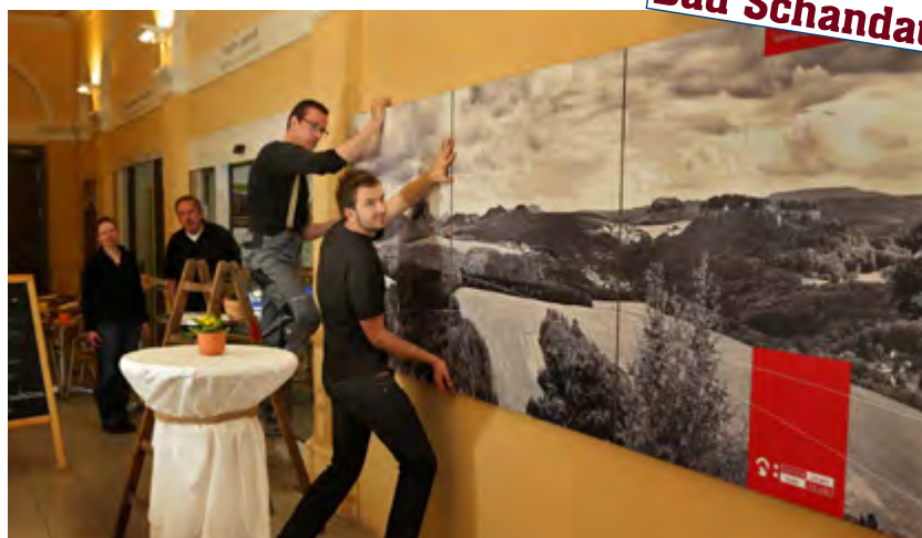
Ein Ort zum Verweilen ist die neu gestaltete Empfangshalle im 1. Nationalparkbahnhof Deutschlands.