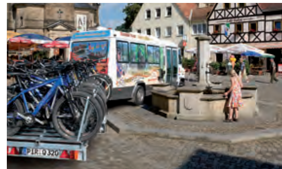
Die bequeme Art die Bastei zu besuchen. Hinfahrt mit dem Fahrradbus und zurück nach Stadt Wehlen mit dem eigenen Fahrrad.