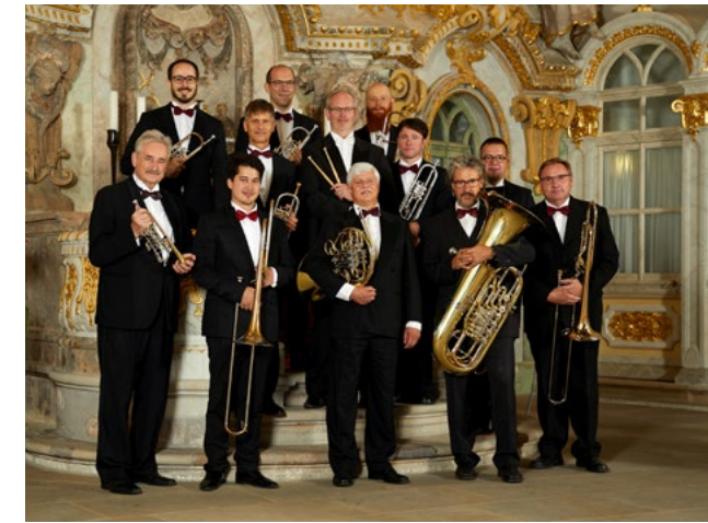
Auftritte des "Blechbläserensembles Ludwig Güttler" mit dem Mitbegründer und langjährigen Künstlerischen Leiter L. Güttler (ganz links) sind ein fester Bestandteil des jährlichen Programms.

„Wer hätte 1991/1992 gedacht, dass aus einer Idee Wirklichkeit werden kann?“, fragt der Vereinsvorsitzende und Mitinitia-