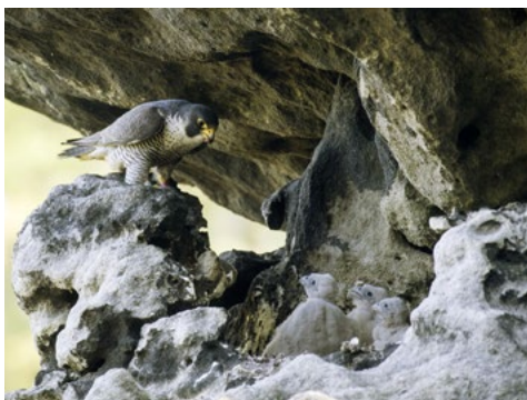
Wanderfalken mit Jungvögeln in einem Felsenhorst

Alljährlich wird in der Böhmisches Schweiz eine Allgemeinverfügung erlassen, die das Betreten bestimmter Lokalitäten im Nationalpark Böhmisches Schweiz verbietet. Diese vorübergehende Maßnahme dient dem Schutz von hor-