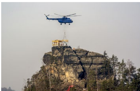
Ein Hubschrauber bringt Bestandteile des neuen Pavillons zum Gipfel des Marienfelsens bei Jetřichovice (Dittersbach).

Ein neuer Pavillon wurde am 24. Februar 2021 mit einem Hubschrauber hochgefliegen. Der Pavillon selbst besteht aus einer Metallkonstruktion, die mit Lärchenholz verkleidet ist. Damit soll eine wesentlich längere Lebensdauer gewährleistet sein, als bei seinen Vorgängern.