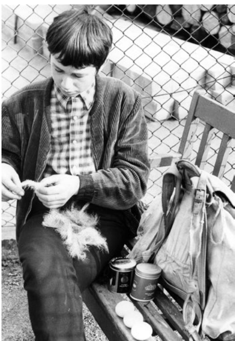
Der Autor nach dem Bergen eines verlassenen Uhu-geleges, am 5. Mai 1972.

Es ist schon 40 Jahre her. Ende März war´s - 1981, kurz vor meiner Einberufung, die dazu dienen sollte die DDR unsterblich zu machen. Also, ich war dazu wohl am ungeeignetsten - wer mich kennt, der weiß warum. Und so war ich dann längere Zeit am Harzrand als besserer „Hausmeister“ stationiert. Aber auch hier begegnete mir Bubo bubo - der Uhu.