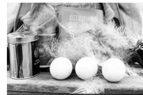
Geborgenes, verlassenes Uhu-gelege, am 5. Mai 1972.