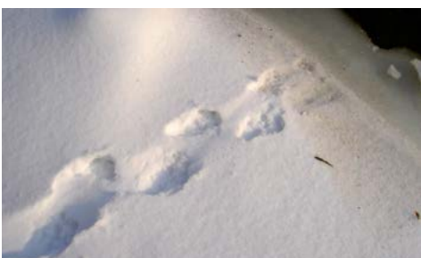
Biberspuren im Schnee

Es ist noch früh am Morgen und die aufgehende Sonne spiegelt sich auf dem Eis des Bergbaches. Am Rande der letzten Ortschaft stehen einige Obstbäume. Sie sind etwas „angeknabbert“. Hier war der Biber am Werk. Seine Spuren zeigen uns