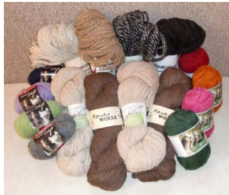
Inka-Gold: Wenn Stroh zu Gold wird.