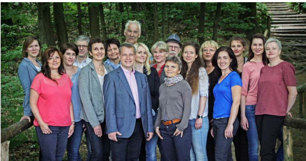
Wir wünschen der Mannschaft des Tourismusverbandes Sächsische Schweiz alles Gute zum Geburtstag.

Nicht dass es vor der politischen Wende keinen Tourismus gab, ab 1991 liegt die touristische Entwicklung der Sächsischen Schweiz jedoch in sicherer und fachmännischer Hand. Wir gratulieren dem Tourismusverband auf das Herzlichste zum 30. Geburtstag.