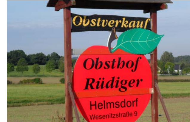
Werbung für ein gutes Angebot – das frische Obst von Rüdigers.

Stichwort „frisch vom Feld“: alle Beersorten, die einen so richtig fruchtigen Sommertraum ausmachen, gibt es hier zum Selbstpflücken. Sogar Blumen kann man sich aussuchen und schneiden. Wann für die jeweilige Obst- und Gemüsesorte „Selbsterntezeit“ ist, gibt Familie Rüdiger auf ihrer Internetseite bekannt.