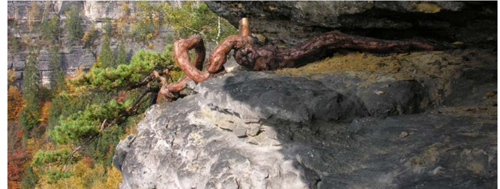
Bild rechts Der Samen dieser Minikiefer keimte einst im eigentlichen Nichts und deshalb kam es auch nicht zur Ausbildung eines Stamms. Ich kenne mehrere solche „Zwerge“, die aber trotzdem ein langes Leben haben können. Nur ein, zwei, drei Nadeln wachsen jedes Jahr neu am Ende der Zweige. „Zum Sterben zu wenig – zum Leben zu viel“. Glücklicherweise wächst diese Kiefer an der Nordseite eines großen Felsriffs.

Diese Kiefer begann ihr Leben in einer feuchten Schichtfuge und hat wohl viele Jahrzehnte lang nie Regen abbekommen, aber durch die Feuchtigkeit aus dem Bergleib begann ihr Dasein. Es ist schon erstaunlich, wie sich der Stamm ans Licht gewunden hat. Da fällt einem der Vergleich mit einer Riesenschlange ein. Der abgesägte Stumpf zeigt, dass die Kiefer vor vielen Jahren mal versucht, hat ein „Baum“ zu werden. Ein Ast wuchs weiter hinaus ans Licht.