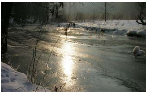
Die ersten Sonnenstrahlen haben den Talgrund erreicht.