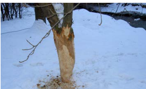
Angenagter Pflaumenbaum am Bergbachrand.