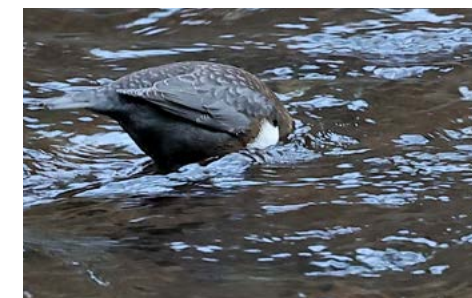
Die Wasseramsel beim Eintauchen in die kalten Fluten.

Noch andere Tierspuren kreuzen unseren Weg. Manche sind auch für Laien gut unterscheidbar, z.B. der schnürende Gang des Fuchses. Er tritt mit der Hinterpfote genau in die Spur, die der Vorderlauf hinterließ. Wie eine Perlenkette verläuft sie sich im Schnee. Oder der hüpfende „Gang“ der Marder. Zwei Abdrücke unmittelbar nebeneinander und das fortlaufend in Abständen von 50 bis 80 cm. Auch hier